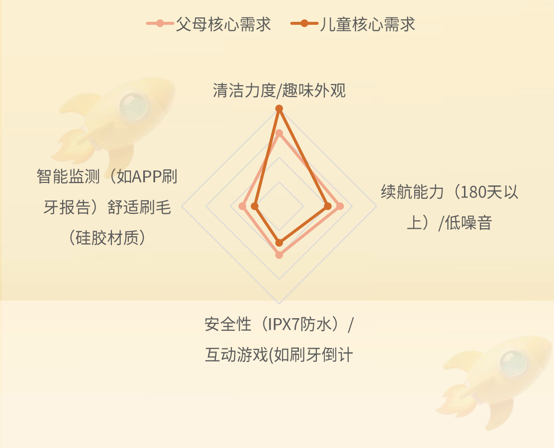
消费者痛点优先级